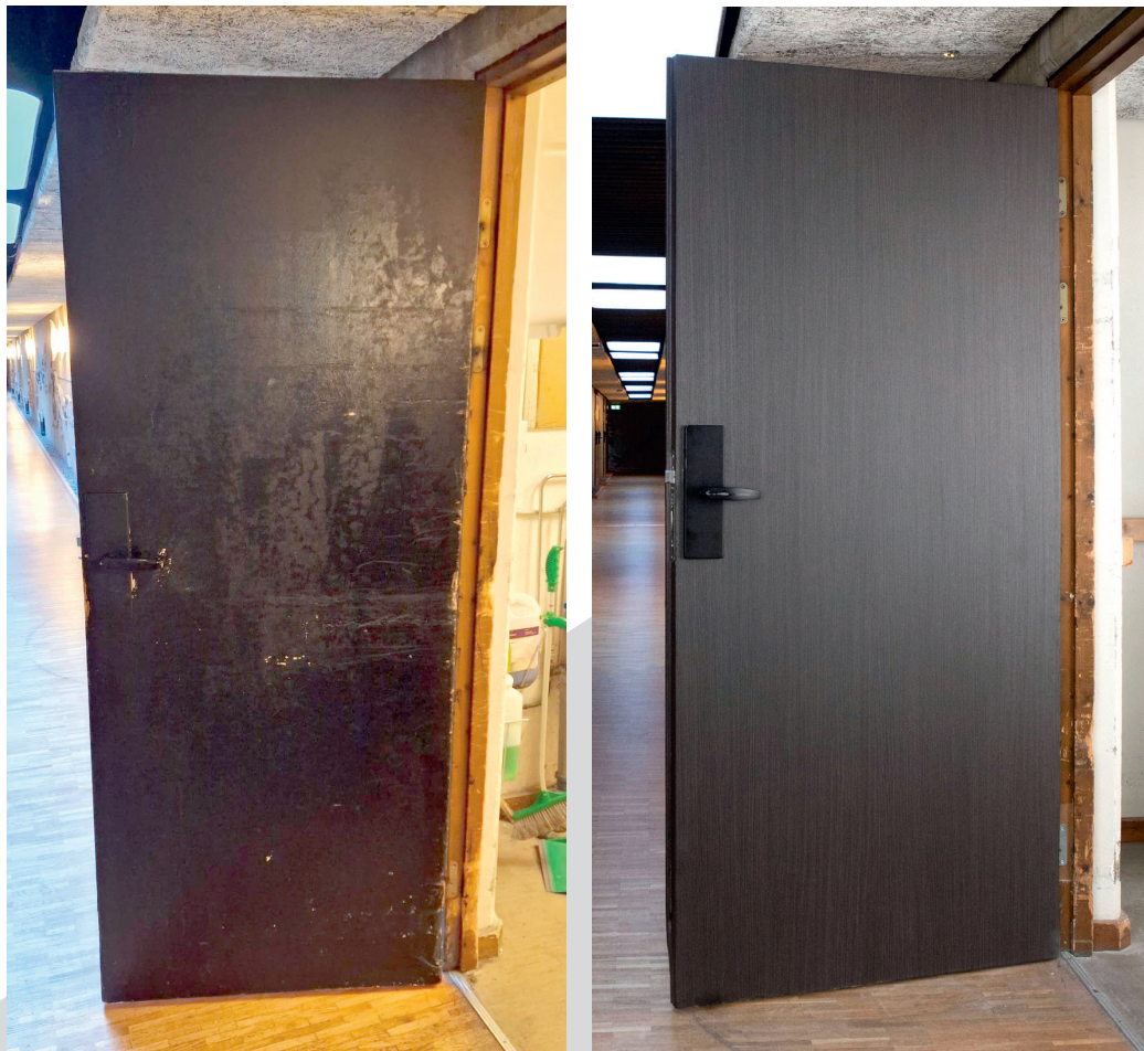
CASE #001 - FÖRE / EFTER